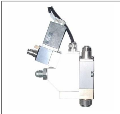
KN 12 - Seitenansicht