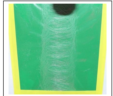
KN 12 - Sprühbild