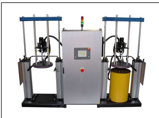
Tandem-Anlage mit automatischer Changeover-Funktion (optionale Ausstattung)

Lieferungen und Leistungen erfolgen nach den aktuellen Geschäftsbedingungen der SM Klebetechnik Vertriebs GmbH